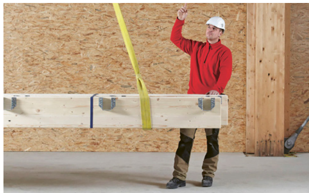
1 Die Ausbildung der Anschläger und Anschlägerinnen soll im gewohnten Arbeitsumfeld stattfinden.

Beim Anschlagen von Lasten ereignen sich immer wieder schwere Unfälle. Deshalb dürfen nur ausgebildete Personen Lasten an Kranen anschlagen. Verantwortlich für die Auswahl und Ausbildung der Personen sind die Arbeitgeber.